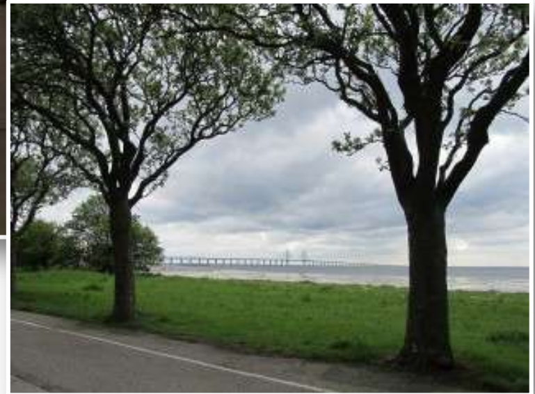
Malmo , vista del lungo ponte che collega la Danimarca alla Svezia.