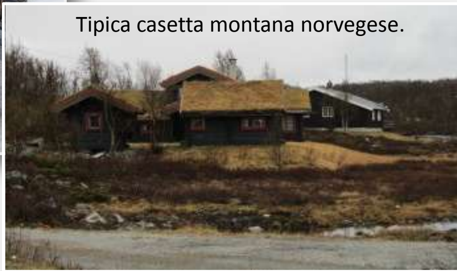
Tipica casetta montana norvegese.

Sosta rifornimento sulle montagne norvegesi, la ragazza alla cassa mi ha detto che non si vedono moto da quelle parti a maggio, e tantomeno moto dall'Italia.. E ci credo, con sto' freddo chi glielo fa' fare? :)