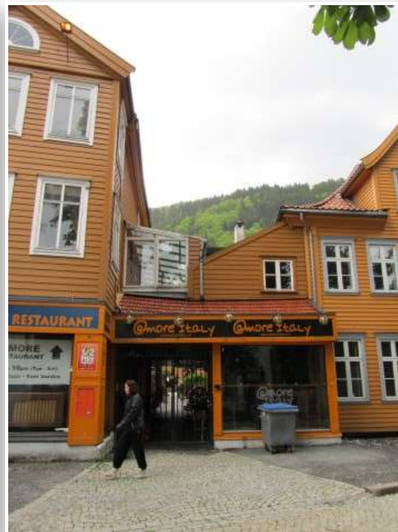
Bergen, centro città' e ristorante italiano.