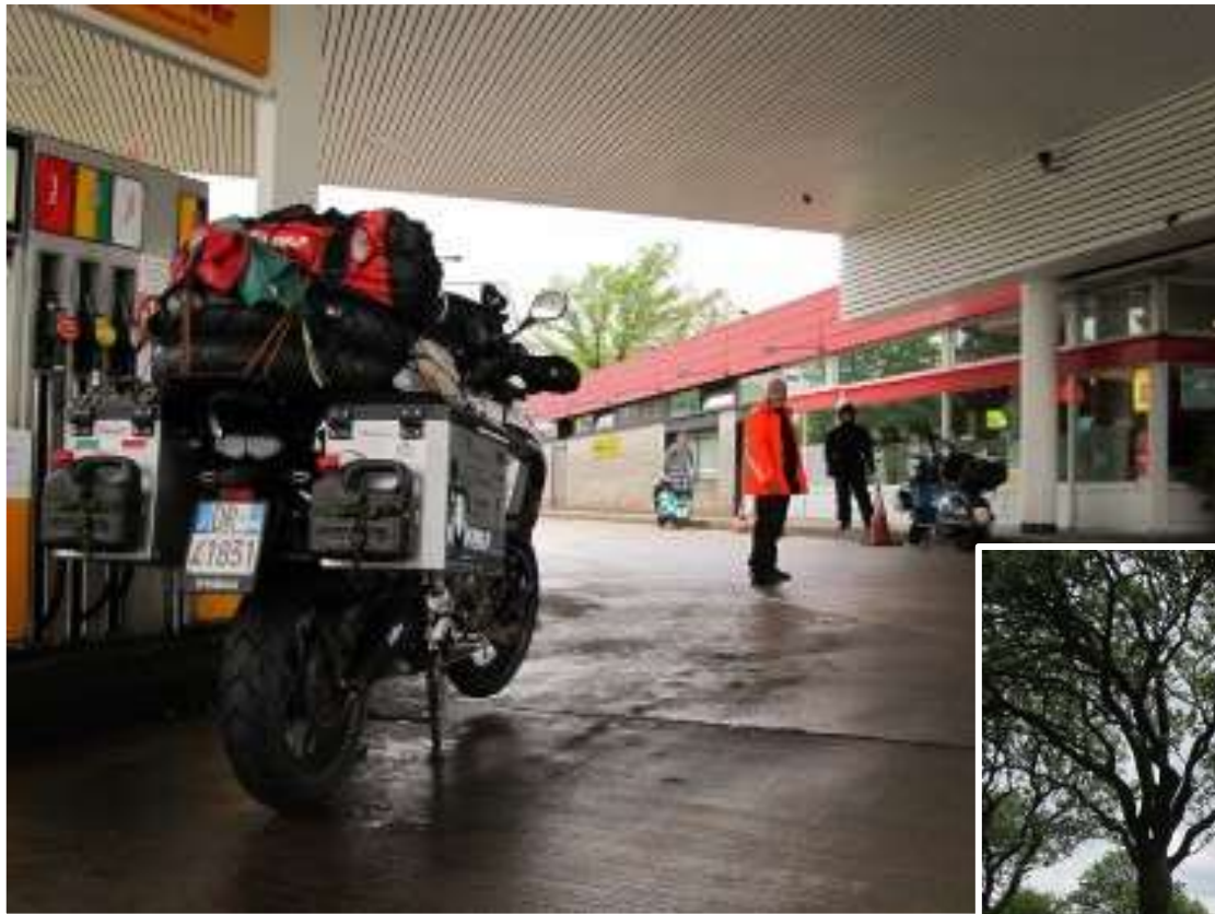
Germania , incontro con 2 italiani in Vespa diretti ad un raduno in Norvegia.